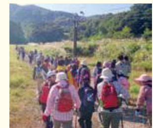
琴引スキー場からの登山道